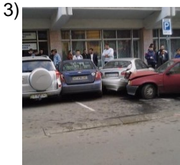
once and for all