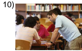
from bad to worse