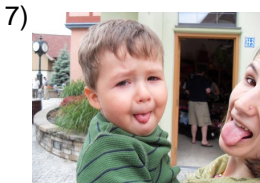
at the same time