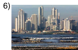
bigger and bigger