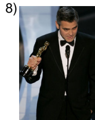
better and better